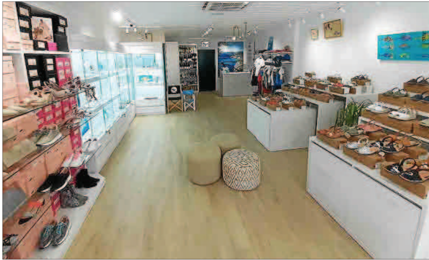
El local, en la avenida Europa de Pozuelo, tiene 70 metros cuadrados.